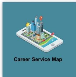
Career Service Map